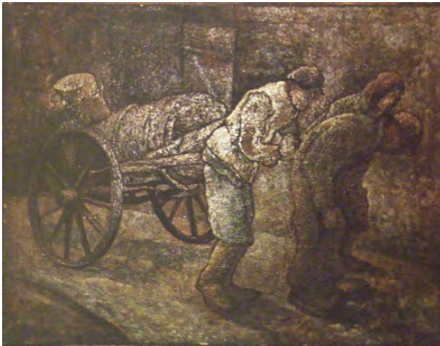
Jozef Kowner. Transportgespann. Lodz. Öl. 26 x 34 cm ZIH Warschau

Mitglied der Gruppe „Start“, stellt 1928 in Lodz Stilleben und symbolistische Werke aus. Kowner zeichnet im Ghetto von Lodz. Einige dieser Zeichnungen werden heute im Jüdischen Geschichtsinstitut in Warschau aufbewahrt. Er wird im Ghetto von Lodz ermordet.