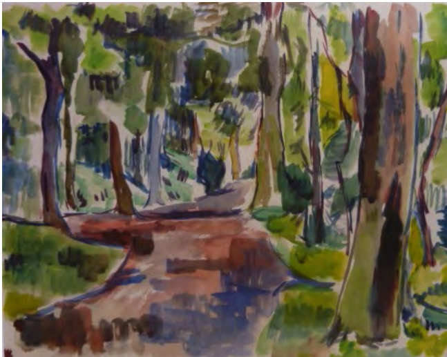
Schattiger Waldweg, 1922. Aquarell, 38,5 x 50 cm Sammlung Gerhard Schneider, Olpe