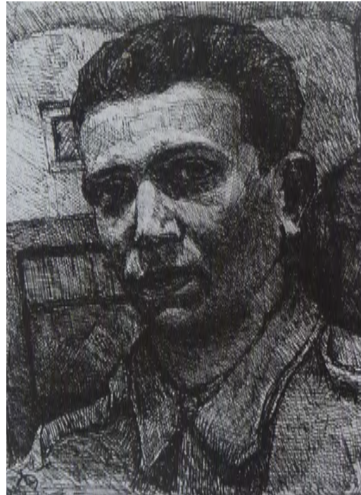
György Kondor. Selbstporträt 1937 Kondor, Lakatos Bélané