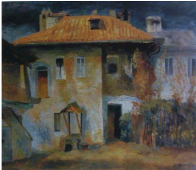
Häuser. Öl/Pappe. 69,4 x 80,3 cm Jüdisches Historisches Institut, Warschau

Studium ab 1918 in Warschau unter der Leitung von Lentz und Pruszkowski. Er geht häufig in seine Geburtsstadt Plock zurück. Ausstellungen mit der Gruppe ZTKSP in Warschau und in Lwiv 1931 und 1932 und in Plock 1929 und 1932. Einzelausstellungen im Salon Garlinski in Warschau (1930) und in seiner Heimatstadt Plock. Im Sommer verbringt er oft mehrere Monate in Kazimierz. In den Jahren 1932 – 1934 beteiligt er sich an Ausstellungen in Kamienica Celejowski, organisiert von der Gesellschaft der Freunde von Kazimierz. Beeinflusst durch die holländischen Meister malt er Landschaften und Architekturszenen, sowie jüdische Kinder. Er stirbt im Ghetto von Wilna.